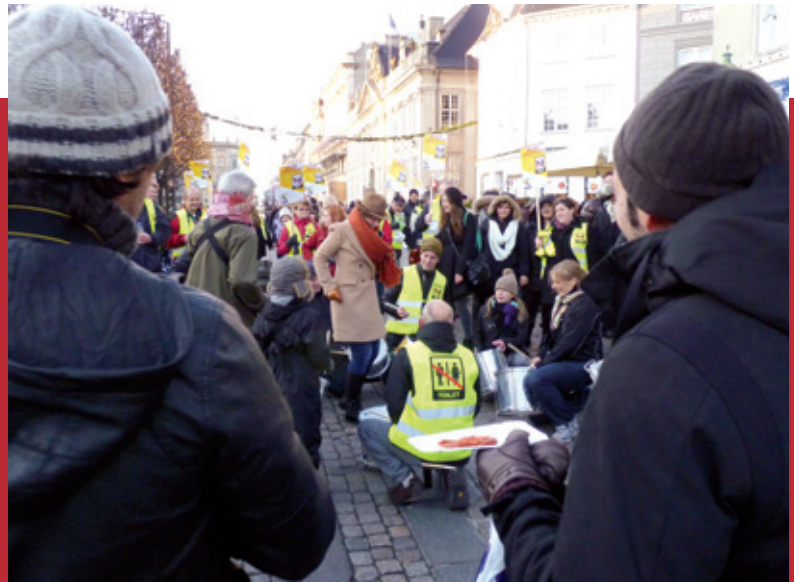
Skæg og ballade undervejs. og en masse nye underskrifter mod lukningen af de bemandede toiletter.