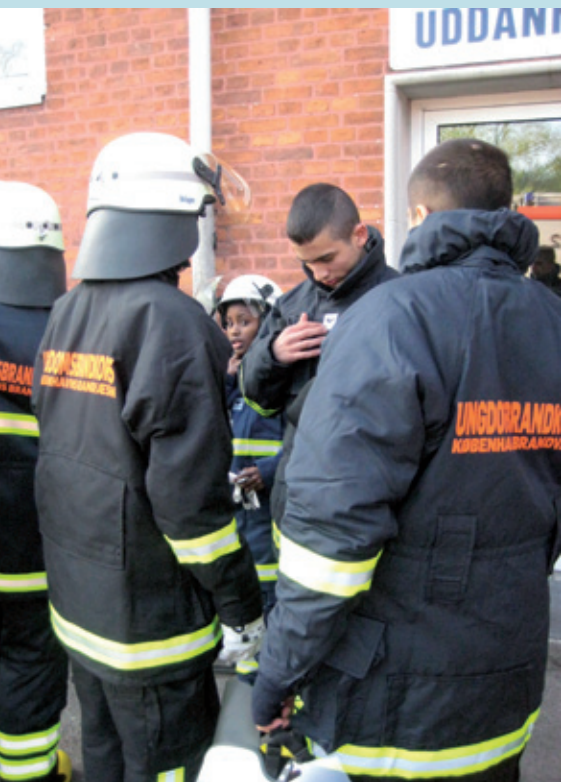
Stoltheden over at blive brandkadet med kompetencer, logo og det hele er stor hos de unge københavnere.

i, de som måske har det svært med skolen, eller som har en dominerende storebror. Det er også bedst med en blanding af ressourcetsvage og mere ressourcestærke unge, og det er skolerne gode til at udvælge.”