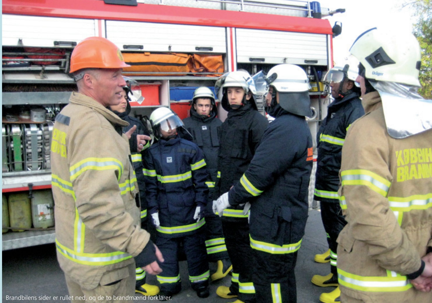
Brandbilens sider er rullet ned, og de to brandmænd forklarer.

Spørgsmål bliver stillet og besvaret, og de unge får klar og kontant information. Bl.a. får de besked om, at de for fremtiden vil blive anvist en plads i klasselokalet, for som en af brandmændene siger, så ved man jo aldrig, hvem man kommer til at arbejde sammen med. Det er nemlig også en del af træningen til brandkadet, at man lærer teamwork på en arbejdsplads: går der to mand ind i en ildebrand, kommer der også to mand ud.