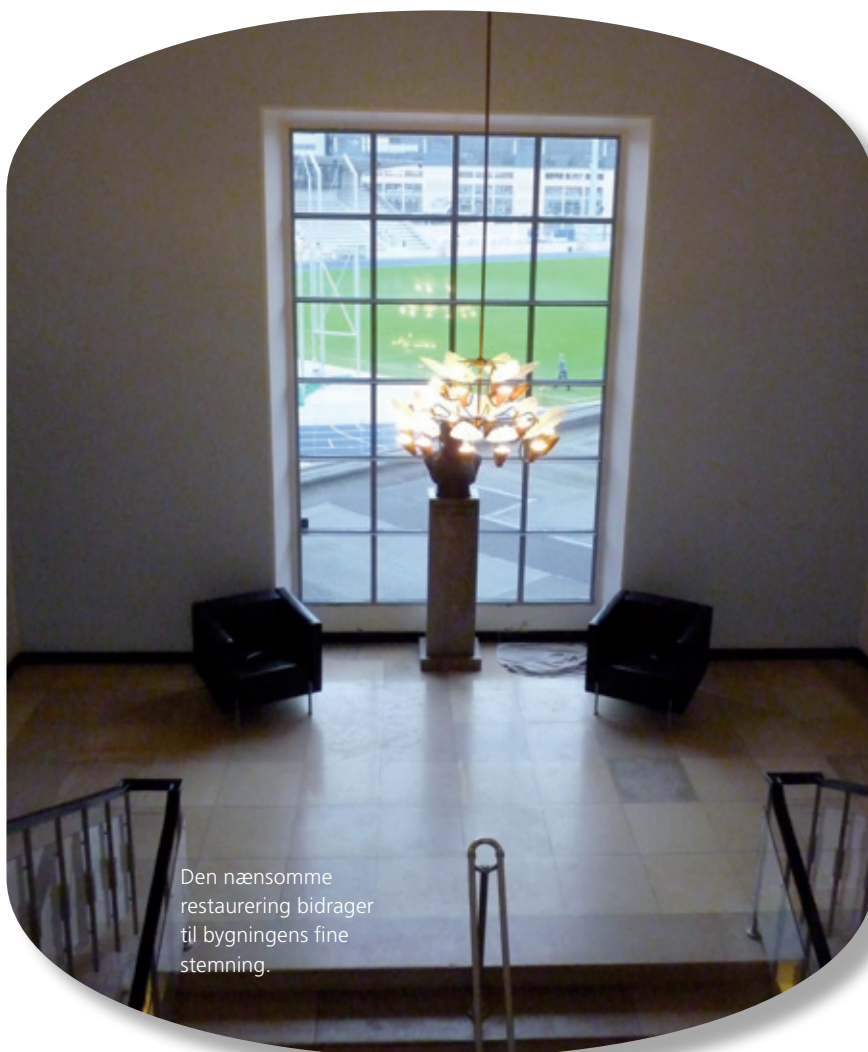
Den nænsomme restaurering bidrager til bygningens fine stemning.

Svømmehallen tilbyder også det såkaldte sauna-gus, og Anne er ofte sauna-gus-mester 1 gang om ugen. Saunagus er aromaterapi i saunen, hvor gusmesteren hælder vand, der er blandet med en komposi-