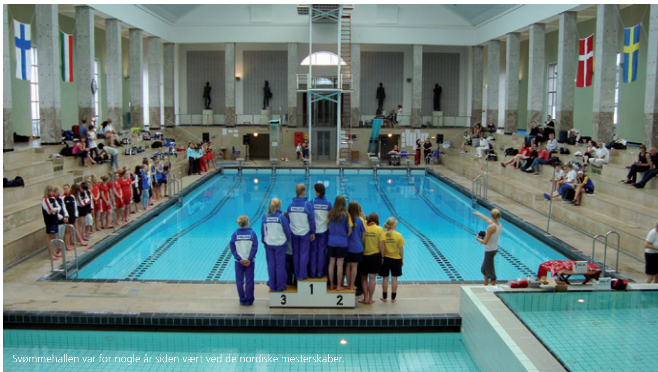
Svømmehallen var for nogle år siden vært ved de nordiske mesterskaber.