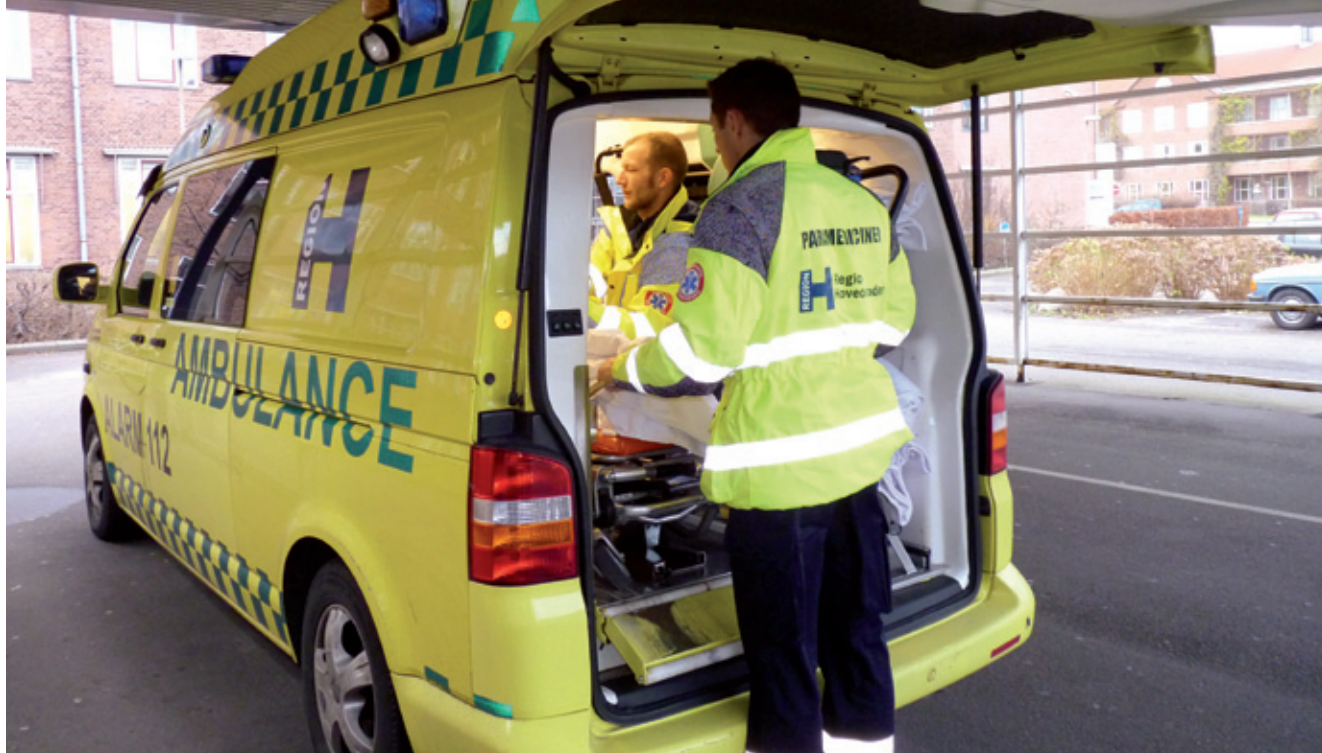
Ambulancefolkene skal have en patient ud af ambulancen.