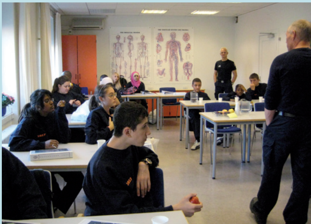
Hele holdet mødes i undervisningslokalet først.